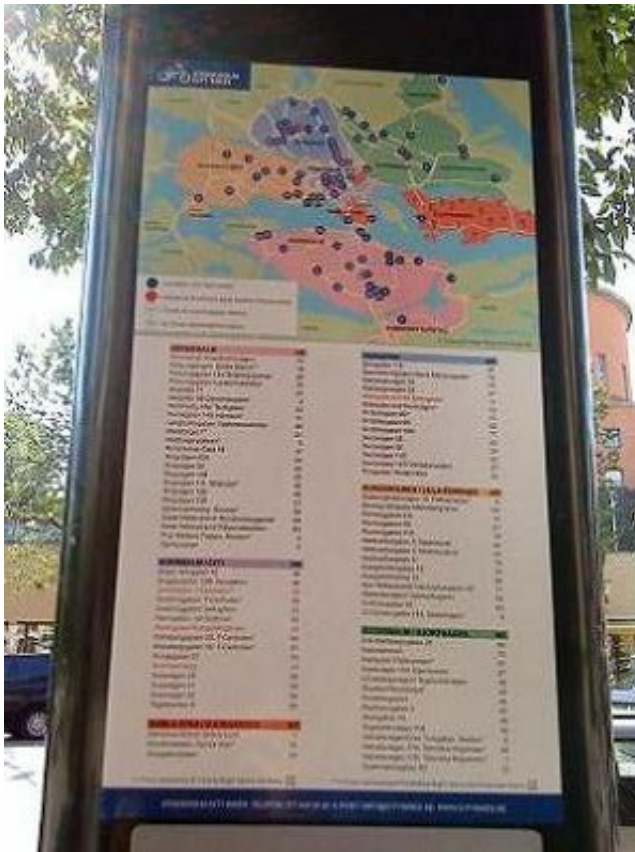
在停放處旁邊的分布圖