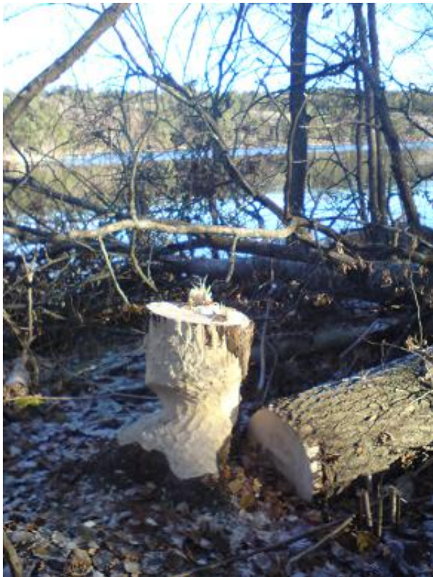
(被水獺啃食的樹幹)

在接近終點穿過湖上的橋時，我們不禁被結了層薄冰的湖面所吸引。結冰的湖面彷彿捕捉了湖水瞬間的動態，湖面下的水草、氣泡、還有伸出湖面的葦草都像被靜止在冰面中，這只屬於北國的景致，當然，又謀殺了不少記憶卡。最後大家的相機裡都裝了滿滿的美景、當然還有回憶與俊男美女的笑影囉！