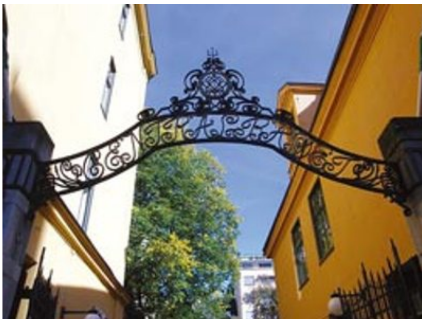
中央澡堂大宅院入口

我結婚以前，我的丈夫告訴我為甚麼選擇在一個海島上舉行婚禮。島上有間小木屋，他盼望著跟自己所愛的人在小木屋一起洗浴。洗澡這件事跟宗教有相同的潔淨感，那時我很為他這個懸念所感動。我慢慢懂得洗澡是愛情的聖堂，或者還是友誼的廳堂，至於是不是親情的場所，我要再想想。傳統的鄉間裡，如果家裡沒有小木屋，友善的鄰居會邀請前往同浴（穿泳衣或披長浴巾）。我聽過最可愛的鄰居聚會是大雪天坐進小木屋裡蒸浴，漫天黑夜，白雪藹藹。眾人一一步出小屋躺在雪地上各人滾各人的，滾盡一身的熱燥紅燙，雪涼清爽，碎瓊亂玉。那時眾生好像回返維京時代的豪邁純情，寒鴉飛去，海盜合唱。