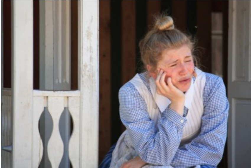
(艾米爾舞台劇，女傭Lina鬧牙疼。攝於林格倫童話主題樂園。)