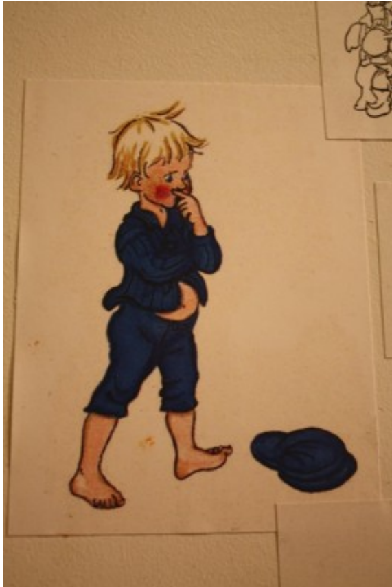
(「艾米爾」Bj?rn Borg繪，攝於斯德哥爾摩的林格倫童話故事館「六月坡」(Junibacken))