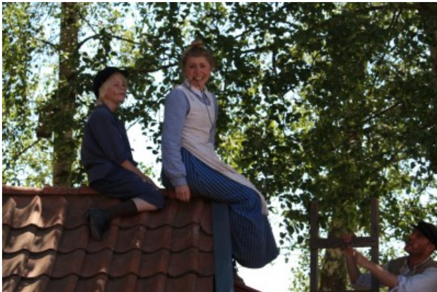
(艾米爾舞台劇，女傭Lina鬧牙疼，沒錢看牙醫，點子特多的艾米爾想出了一個絕妙的辦法幫她，這辦法到底行不行得通呢？詳情請看艾米爾第三集。攝於林格倫童話主題樂園。)

總之，真的很開心艾米爾系列中譯本終於在艾米爾慶五十周年的2013年於台灣出版。有人說父母總會偏心，特別偏愛某個孩子，我想譯者亦是如此。在翻譯過的童書作品中，艾米爾是我特別喜愛的一個角色。希望讀者們也喜歡這套作品。